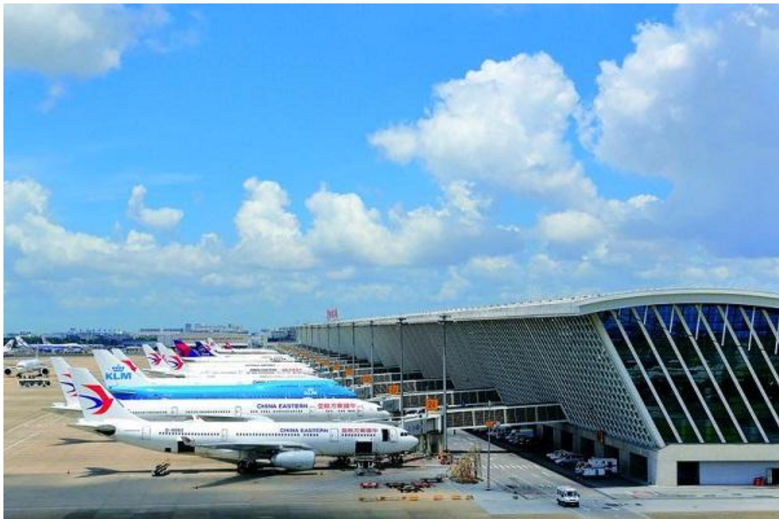
上海浦东国际机场

出游计划，甚是方便。1978年上海空港年旅客吞吐量刚刚超过40万人次；40年后，完成40万吞吐量，浦东、虹桥两大机场加起来只需要一天多一点的时间！从1999年浦东机场T1开航，到2008年浦东机场T2启用，再到2010年虹桥机场T2登场，目前已有110家航空公司开通了上海的定期航班，联通全球47个国家、297个通航点，其中国际航点133个。2017年，上海两场的客货吞吐量分别占全国机场的9.8%和26.2%；国际客货吞吐量分别占全国机场的26.6%和48.2%