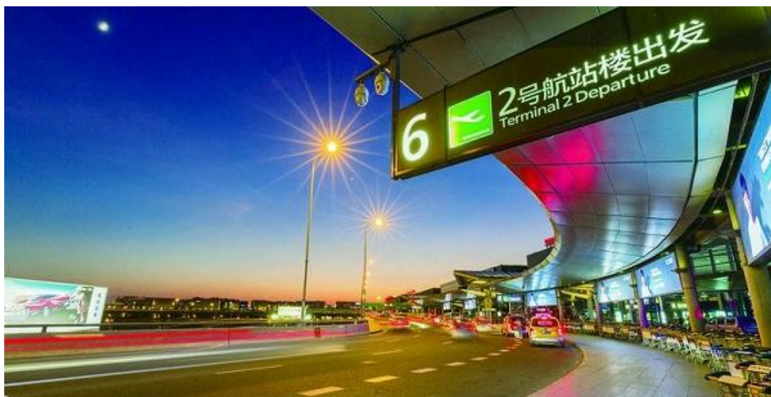
上海虹桥国际机场